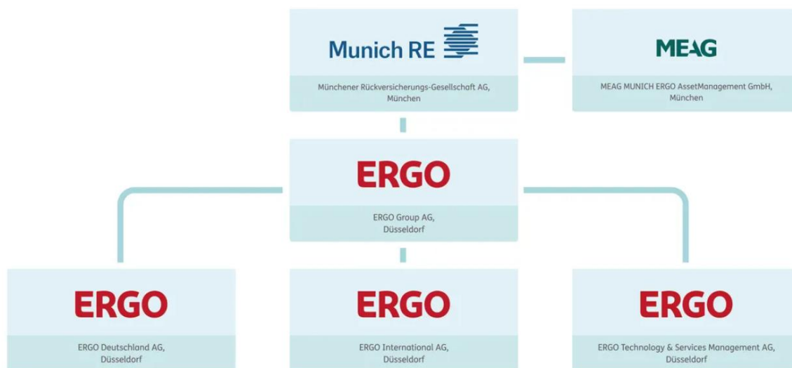
Joonis 2. Munich Re ja ERGO Group AG struktuur

Ettevõtte ainuomanik on ERGO International AG (Saksamaa), mis on ERGO Group AG (Saksamaa) osa, mis on omakorda Munich Re grupi (Münchener Rückversicherungs-Gesellschaft AG (München)) osa, vaata joonist 1 allpool. ERGO grupp on üks suurimaid kindlustusgruppe Saksamaal ja Euroopas ning pakub laias valikus kindlustusteenuseid.